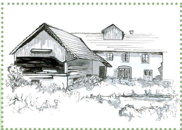
Knupležev mlin