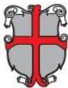
Mestna občina Ptuj