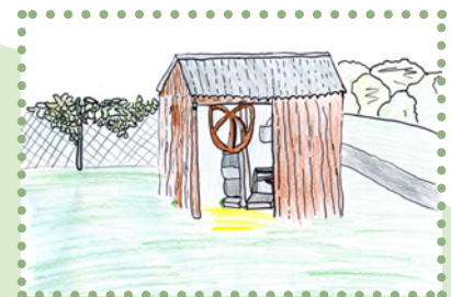
Žagarjev vodnjak z nadstrešnico in kolesom (risba: Karin Najdenik, 5. r.)