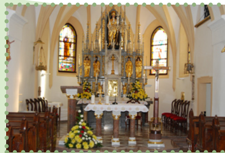
Glavni oltar v cerkvi je posvečen farnemu zavetniku.

Cerkev je poimenovana po svetniku sv. Juriju, ki je bil začetnik viteзов, vojakov, poljedelcev, živinorejcev in vinogradnikov. Cerkev sv. Jurija v Slovenskih goricah se prvič omenja leta 1388. Sedanja župnijska cerkev z osrednjo gotsko ladjo je bila sezidana leta 1501. Cerkev odlikuje ubrana notranjščina in bogata oprema s tremi oltarji.