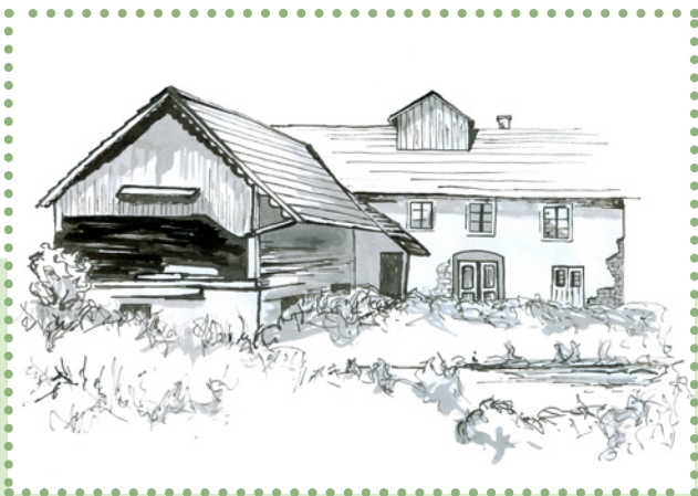
Knupležev mlin